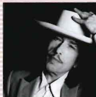
¡Buenas tardes, señorita!, ¿se viene usted a Ávila, Cuenca o Mérida con este su seguro servidor?