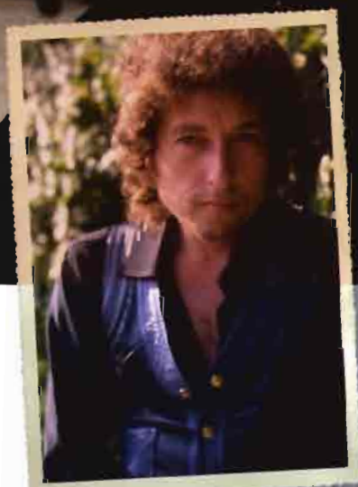
El Dylan de finales de los setenta, época de baja credibilidad artística e inesperada conversión al cristianismo

vuestros sueños”), enunciando con claridad su postura en esa bisneta sónica de «Like a Rolling Stone» que es la flamante «Workingman’s Blues #2»: “El poder adquisitivo del proletariado desciende / El dinero se ha vuelto débil y vacío / Dicen que los sueldos bajos son una realidad / Si queremos competir en el extranjero”.