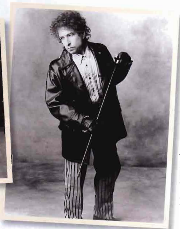
Recuperado como egregia figura cultural, Dylan ha ganado un Oscar y el Príncipe de Asturias que no recogió