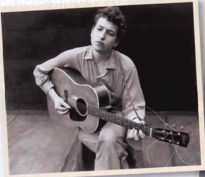
Mezcla de niño prodigio y artista ambicioso, Dylan llegó a Nueva York en 1961 y galvanizó la escena folk

Dinamitó la purista escena folk, otorgó validez artística al pop, transformó el rock'n'roll en Rock, impuso su personal tono vocal, hizo literatura desde las listas de éxitos... pocas figuras del S.XX tienen su estatura. Este mes vuelve a visitarnos en su gira más extensa.