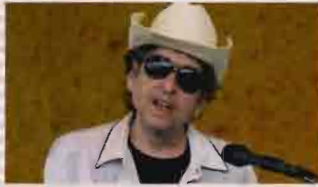
Dylan y los Muertos, el inicio de un Neverending Tour que sigue en marcha

Mucho se ha hablado, y se habla, del tour eterno que Bob lleva dos décadas protagonizando. Inusual incluso en alguien tan poco previsible como él, esta gira sin fin tiene un punto de partida claro: el club Front, situado en San Rafael, California. El propio Dylan señala el encuentro que transformó su carrera en Crónicas Volume 1 cuando describe el estado de apatía en el que se encontraba, embarcado en una serie de conciertos junto a Petty y sus Heartbreakers que le transmitían la sensación de ser un invitado de segunda, consciente de que Tom era la atracción principal para la inmensa mayoría de los compradores de tickets. Era incapaz de encontrar motivación en un cancionero que no significaba casi nada para él, al que no podía insuflar nuevos bríos, nueva vida. Narra en sus memorias cómo aprovechó unas fechas libres para, aconsejado por el organizador de sus conciertos, contactar con Grateful Dead. García, Weir y compañía (declarados seguidores de su música, valgan como ejemplo dos referencias de